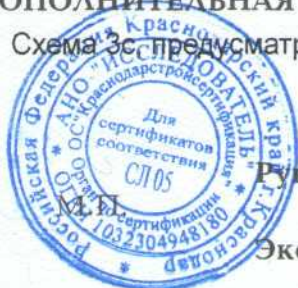
Схема 38 предусматривающая проведение инспекционного контроля не реже одного раза в год.